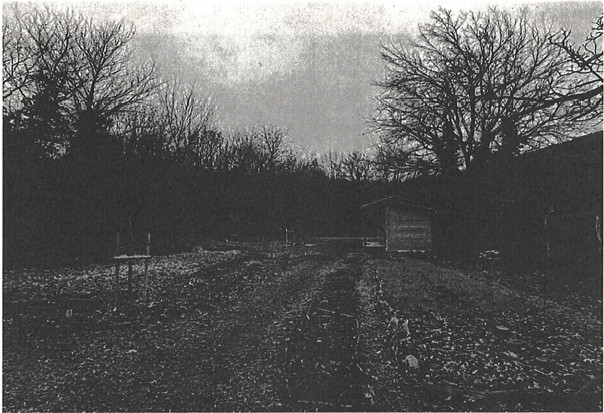
Önkormányzat által telepített cseresznyefa