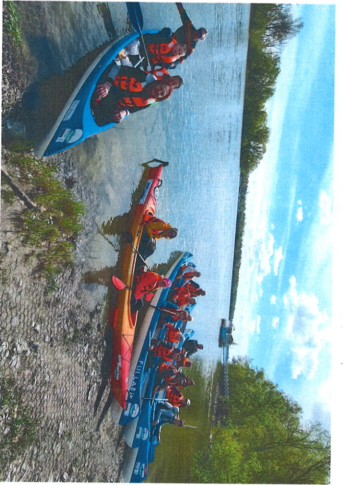
I. Oklahoma 18/19 ft