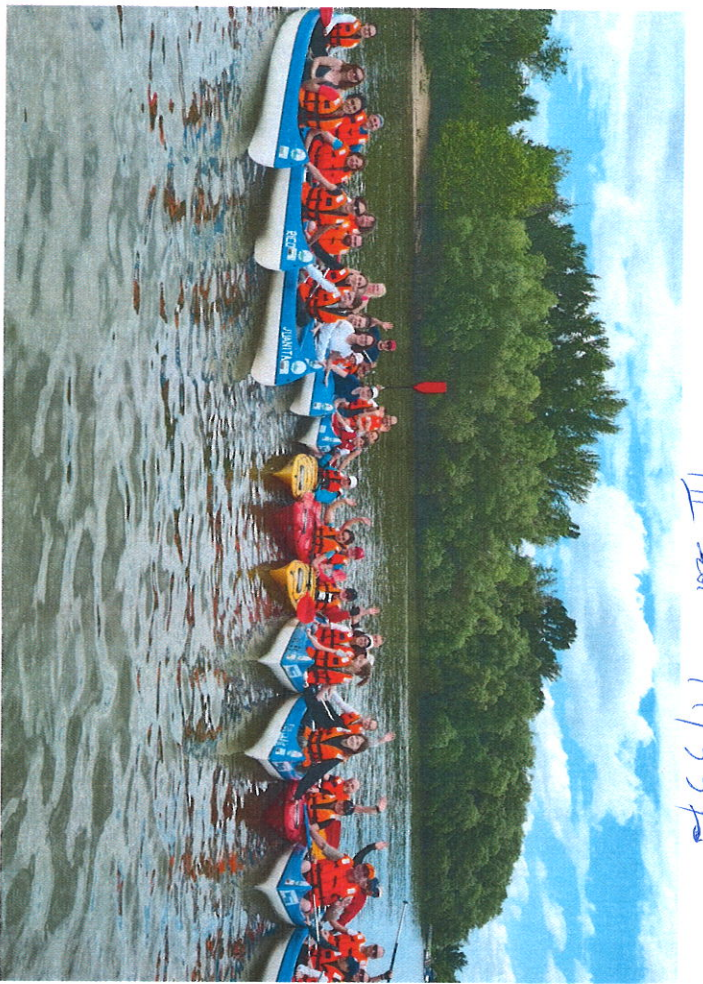
III - Oklahoma 5/1/33 ft