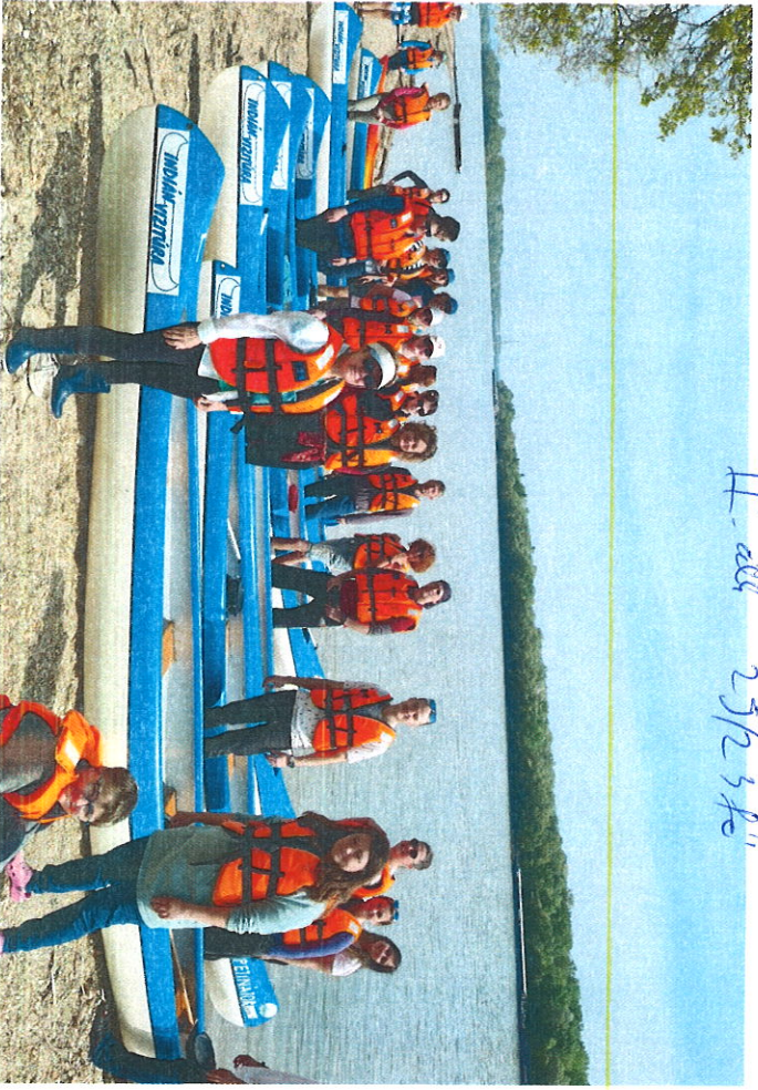
II - Oklahoma 2/5/23 ft